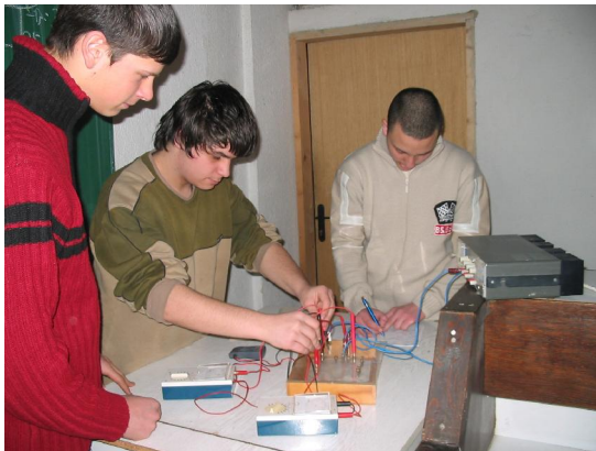
Кабинет за електронику