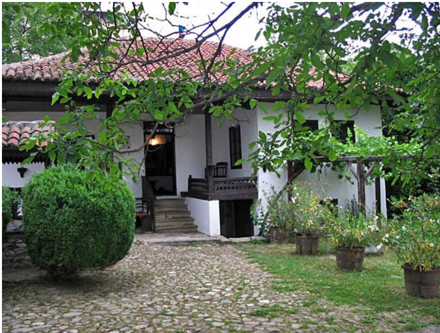
Кућа Боре Станковића

Од културних објеката Врање има: два музеја, позориште, концертни простор, библиотеку, галерије, Дом културе, петнаест основних и седам средњих школа. Славу Врања у Србији а и шире пронео је један од највећих српских писаца, Бора Станковић.