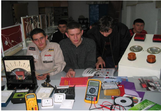
Кабинет за ел. мерења

Ово је укратко о нашој школи, а надамо се да ће те кроз међусобне разговоре са својим колегама и друговима сазнати о школи много више.