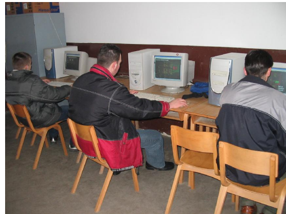
Симулације на рачунару

ЋАЦИ И ПРОФЕСОРИ ТЕХНИЧКЕ ШКОЛЕ У ВРАЊУ ЖЕЛЕ ВАМ МНОГО УСПЕХА У ТАКМИЧЕЊУ!!!